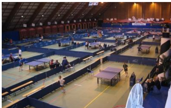
Salle du SPORTICA à GRAVELINES