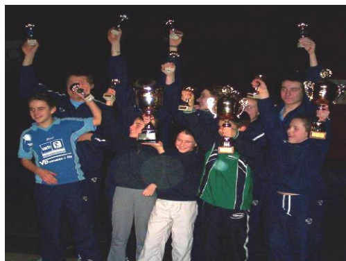
Vainqueur du challenge « BERNARD JEU » 2006/2007 : ULJAP RONCQ 1