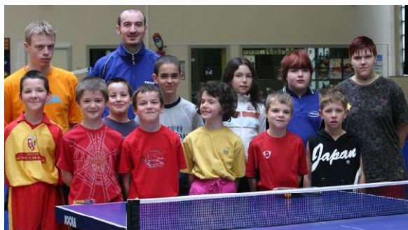
Pôle de formation de la Côte d'Opale à BOULOGNE SUR MER

1659 h/B.E. ont été dispensées au cours de ces stages.