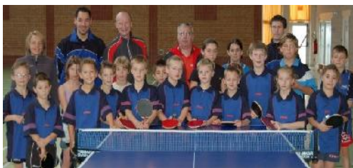
Les Groupes de Détection et de Perfectionnement en 2006 / 2007

Tout comme la saison dernière, les joueurs du groupe rencontreront leurs homologues du comité du Nord pour des entraînements en commun.