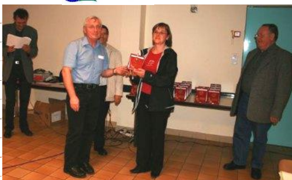
Le Conseil de l'Ordre du Pas-de-Calais