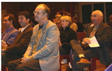
Vue de l'assistance.