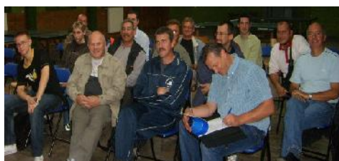
Le Calaisis à l'O.A.J.M. CALAIS