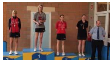
De gauche à droite : Benjamines, Minimes, Cadettes En dessous : Juniors