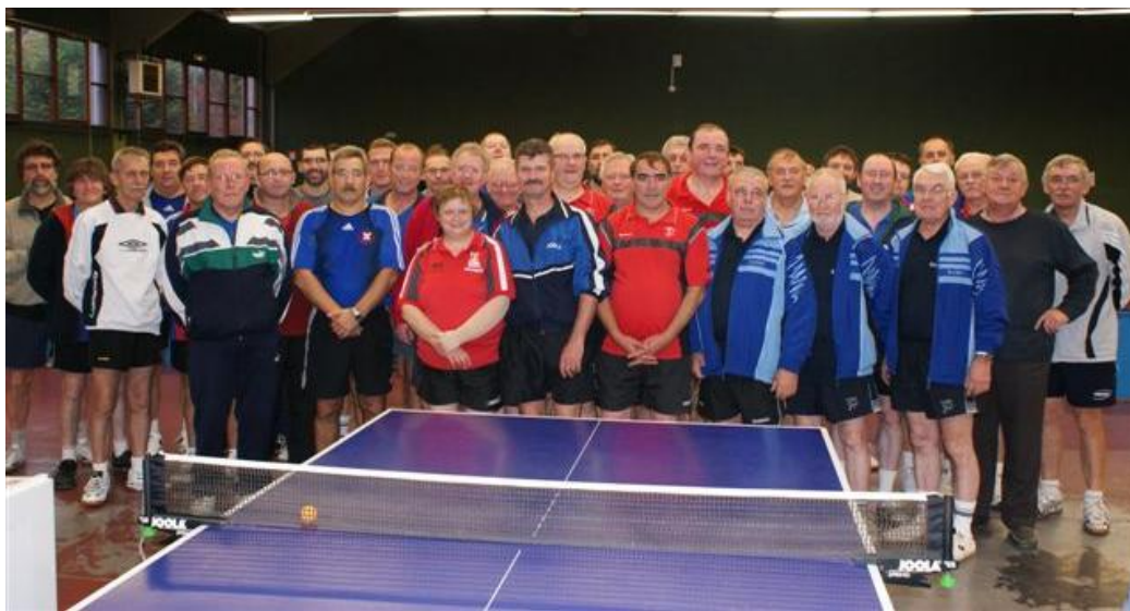
Les participants à l'échelon départemental de la Coupe nationale Vétérans

Souhaitons bonne continuation pour les représentants du CD62TT lors de l'échelon régional qui se déroulera dans la même salle de LONGUENESSE le dimanche 15 février 2009 et pour les finales nationales à CHARLEVILLE MEZIERES les 6 et 7 juin 2009.