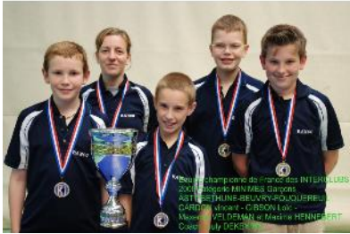
Les Minimes de l'ASTT BETHUNE-BEUVRY-FOUQUEREUIL champions de France des Interclubs 2007/2008

Tout comme la Coupe Nationale Vétérans, l'échelon départemental des Inter clubs s'est déroulé le dimanche 26 octobre dans la salle Marguerite Yourcenar, en collaboration avec le club de l'ASTT BETHUNE-BEUVRY-FOUQUEREUIL.