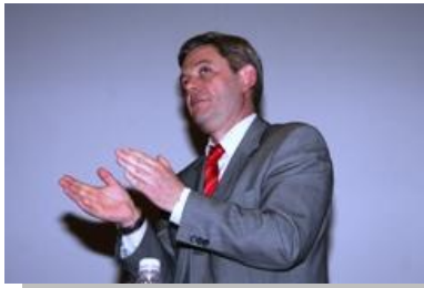
Archives – Alain DUBOIS, Président de la F.F.T.T.

Les efforts pour récompenser et encourager les clubs à l'effectif réduit, ceux que le monde pongiste appelle «les petits clubs », ne semblent pas trouver un écho favorable. C'est à croire que les sommes distribuées en bons d'achats ne les intéressent pas. L'amélioration gratuite des conditions de jeu dans leur club ne semble pas les préoccuper, car cinq clubs récompensés du Pas-de-Calais, n'étaient pas représentés.