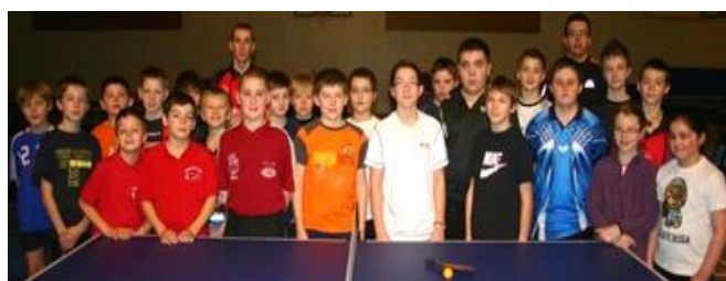
Stage Pôle Côte d'Opale à BOULOGNE-SUR-MER