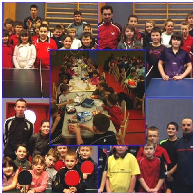
Stage Pôle Lensois à BULLY-LES-MINES