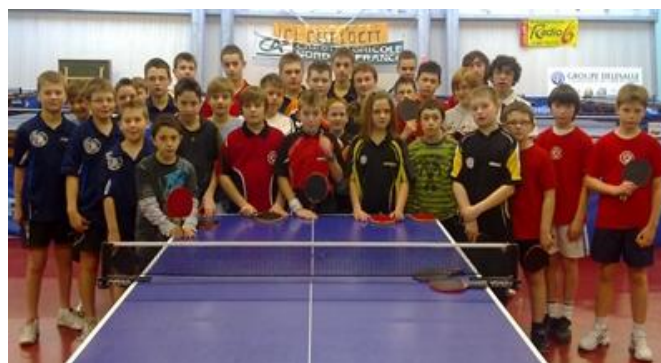
Stage Pôle Calaisis à CALAIS

2) Stages inter départementaux du 28 février au 4 mars à BEUVRY.