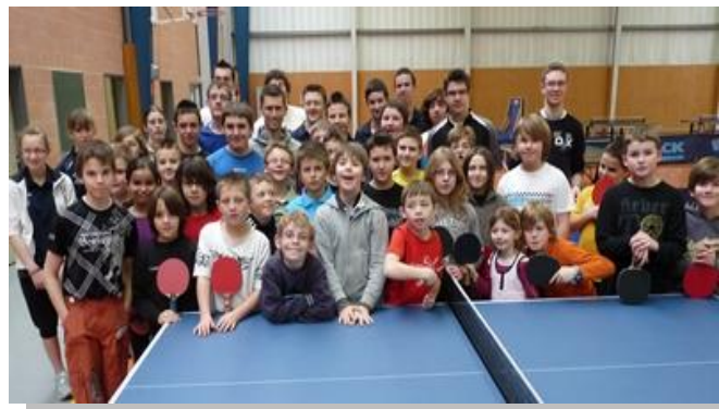
Stage Pôle Audomarois à SAINT OMER